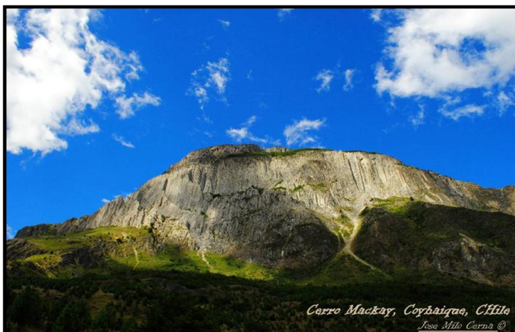
Cerro Mackay, Coyhaique, Chile José Mito Cerna ©